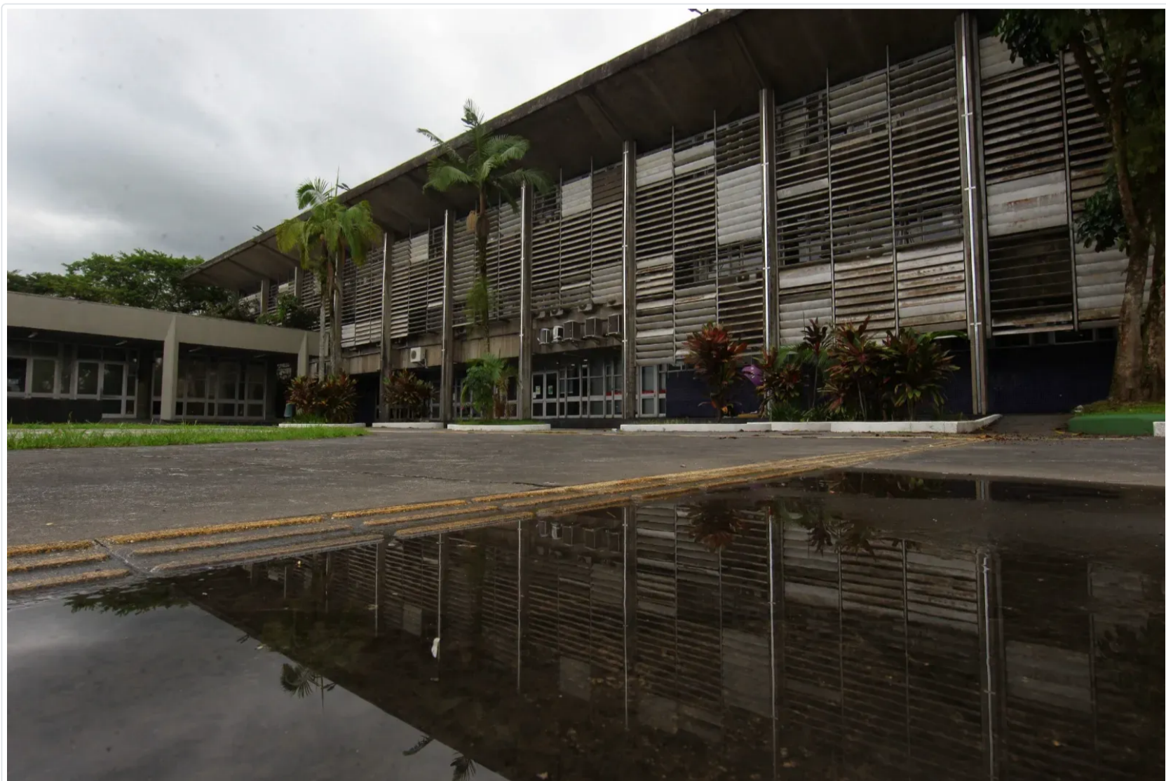
Funcionários recebem salário reduzido sem aviso prévio

Por: ATribuna.com.br - 29/12/23 - 08:05 Atualizado em 29/12/23 - 12:50