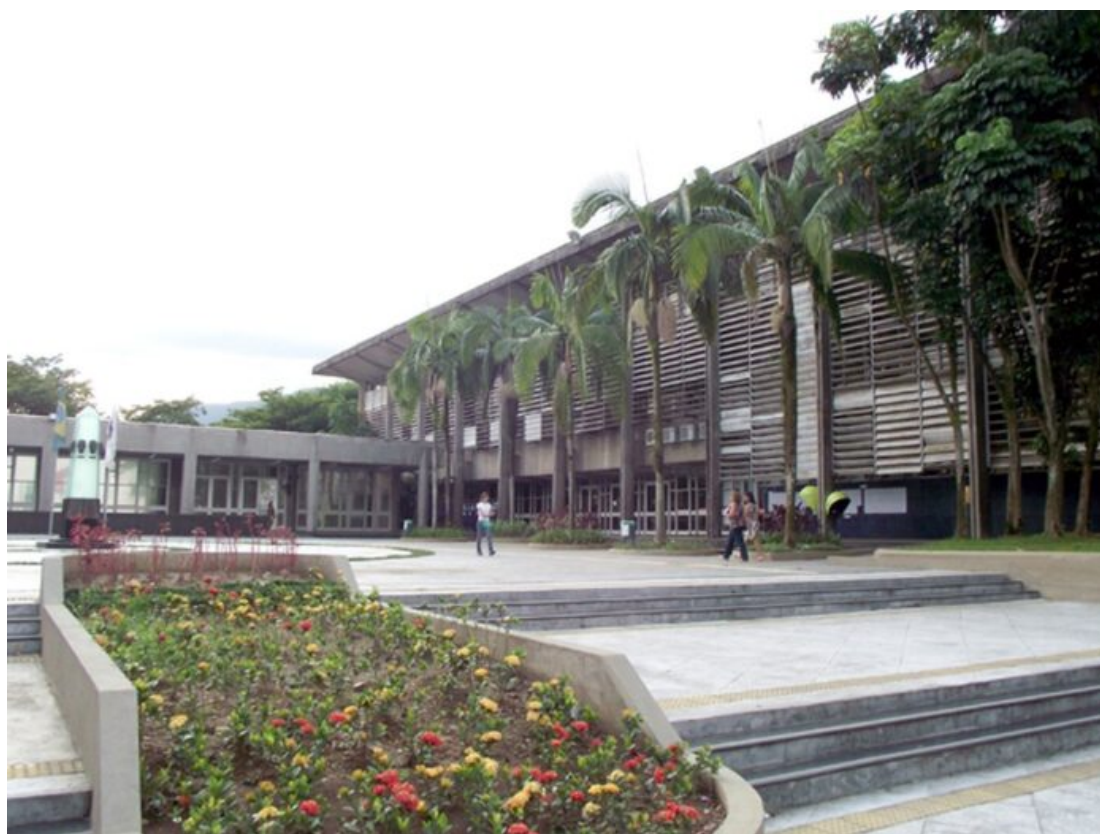
Prefeitura de Cubatão

Por Luís Henrique Santana - 29/12/2023 15:28